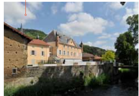
Extrait du Parcours : 4 points d'accueil dont la Maison de la Biennale (A4), salles de conférences et d'ateliers, espaces pour les chapiteaux