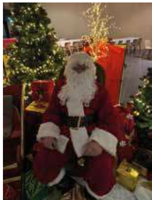
Fête de Noël

Quelle belle année encore à Dolomieu ! Des grands moments ont rythmé la vie du village, entre rires, musique et partage.