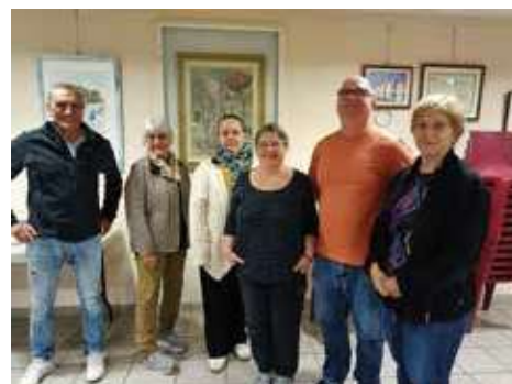
Cours d'italien débutants