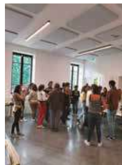
Café rentrée 2025

Ce fut également l'occasion d'intégrer des nouveautés : Café-rentree en septembre, Festivités d'Halloween en octobre, Vente de crêpes pour la Chandeleur en février.