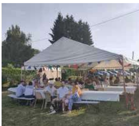
1ère fête d'été le 14 juin