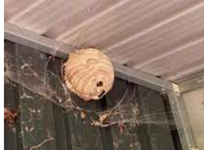
Abris à bois, rue des acacias