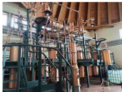
La distillerie Zanin