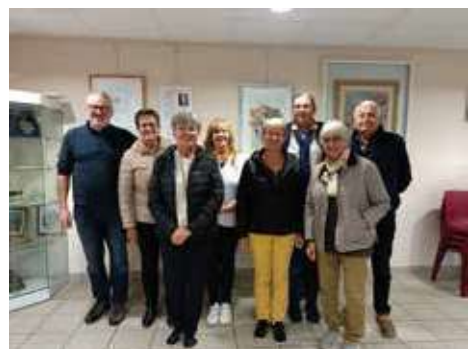
Cours d'italien Confirmés

Elles vous ont accueillis lors du forum des associations de Dolomieu où vous avez été nombreux à venir vous inscrire pour les cours d'italien. Vu l'augmentation du nombre d'élèves, nous avons pu mettre en place un troisième créneau et accueillir le niveau débutant.