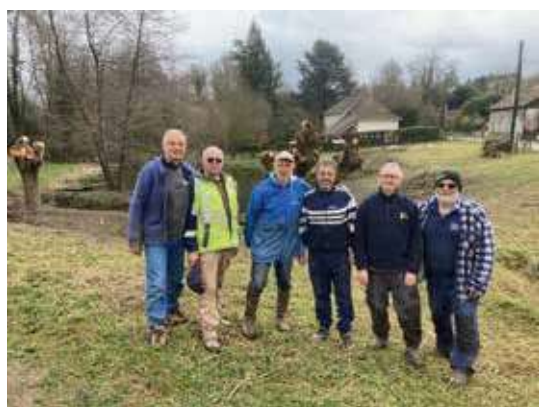
Une partie du groupe des élagueurs

Toute l'équipe vous souhaite de bonnes fêtes de fin d'année.