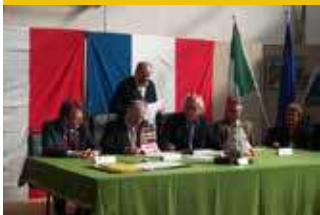
Cérémonie Jumelage Agordo en 2005