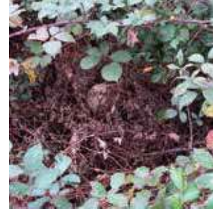
Nid dans un roncier