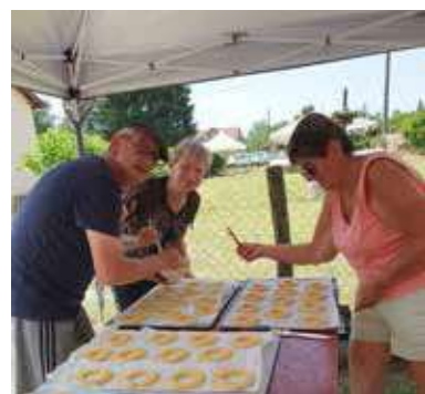
Le retour des craquelins