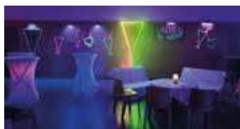
Soirée Ladies Night