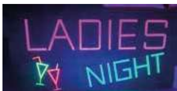
Soirée Ladies Night

Et pour clore l'année en beauté, la soirée « Ladies Night » a fait vibrer Dolomieu jusqu'au bout de la nuit ! Entre musique, danse et bonne humeur, la soirée a été un vrai moment de partage et de convivialité.