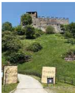
Château de Zumelle