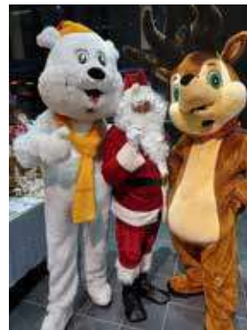
Marché de Noël

Des manifestations et ventes traditionnelles se sont renouvelées : Marché de Noël, Vide-Grenier, Vente de Brioches, Kermesse, Vente de chocolats de Pâques et d'objets personnalisés.