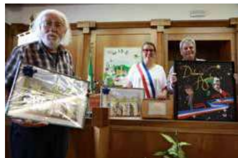
Remise des cadeaux 2025

Lors de ce séjour, nos amis italiens nous ont concocté un inoubliable programme qui a permis de mêler la culture (Château de Zumelle construit au Moyen-âge, la Villa Giusti, la distillerie Zanin...), le sport (lors du match de football France - Italie que les Dolomois ont mené avec brio) et la gastronomie italienne généreuse.