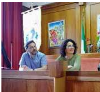
Présidents des Comités de Jumelage