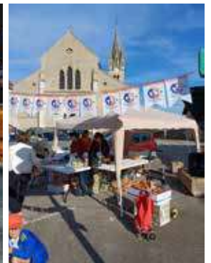
Vente de brioches