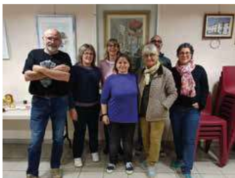
Cours d'italien Intermédiaires