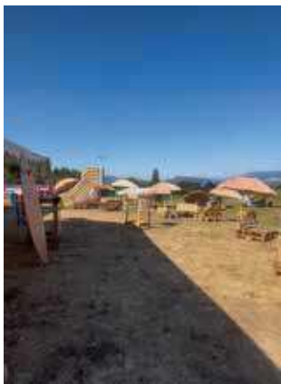
Fête du village

La fête du village, quant à elle a ouvert la saison estivale dans une ambiance des plus conviviales. Sous un grand soleil, habitants et visiteurs ont profité des animations, des jeux, du repas et de la soirée dansante. Sans compter sur notre traditionnel feu d'artifice pour éblouir les visiteurs.