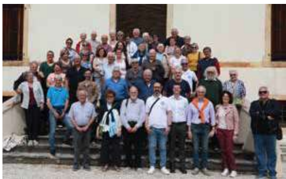
Le groupe devant la Villa Giusti

Lors de ce séjour, nos amis italiens nous ont concocté un inoubliable programme qui a permis de mêler la culture (Château de Zumelle construit au Moyen-âge, la Villa Giusti, la distillerie Zanin...), le sport (lors du match de football France - Italie que les Dolomois ont mené avec brio) et la gastronomie italienne généreuse.