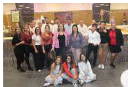
L'équipe du comité des Fêtes

Un grand bravo aux bénévoles du comité des fêtes et un énorme merci à tous ceux qui participent, d'une manière ou d'une autre, à la vie et à l'animation de notre beau village. Rendez-vous l'année prochaine pour encore plus de moments festifs et chaleureux !