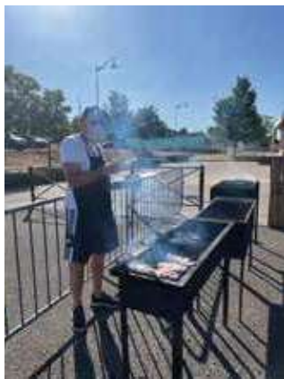
Fête du village