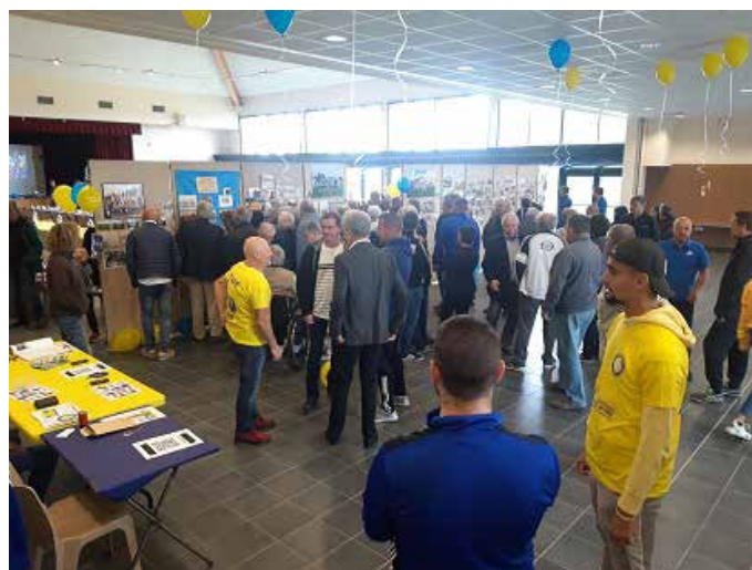
Exposition des 80 ans du club