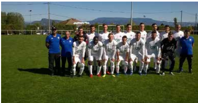
Coupe de FRANCE

Nous avons pu nous appuyer sur nos supporters et les tours de coupe à domicile ont donné lieu à un très beau spectacle sur le terrain et autour avec une belle ambiance et près de 450 supporters pour le 3 ème et 4 ème tour.