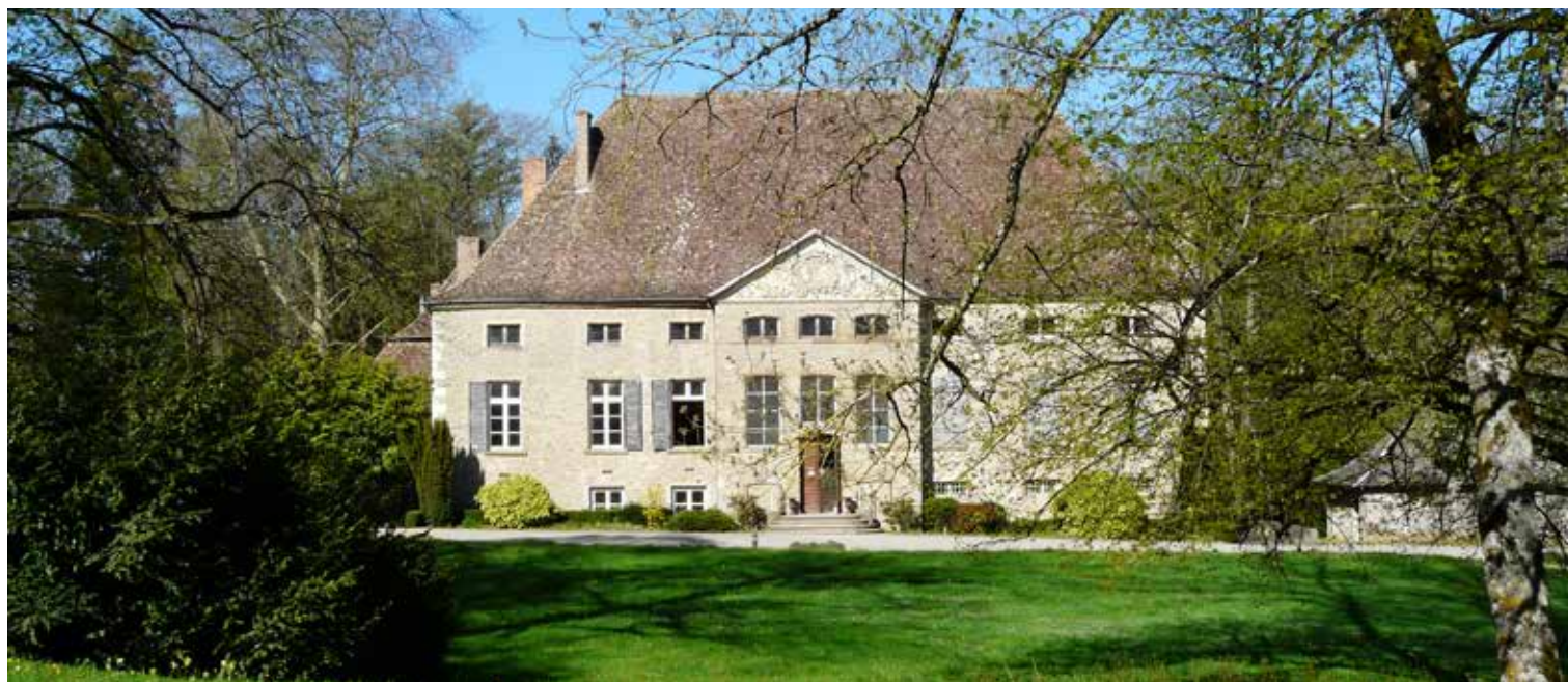
Le Château en 2013

Interview réalisé par D. Hartmann grâce à Maurice Moulin