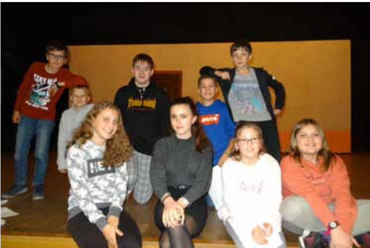
Groupes 1 et 2 de la troupe des «Petites Têtes»

En attendant de vous accueillir dans l'une de nos sections, je vous souhaite une bonne saison culturelle et sportive, dans un monde qui a toujours plus besoin de tolérance, de partage et d'élévation personnelle et collective.