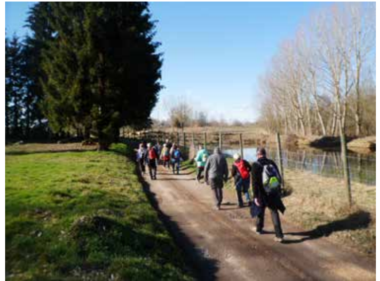
St André le Gaz