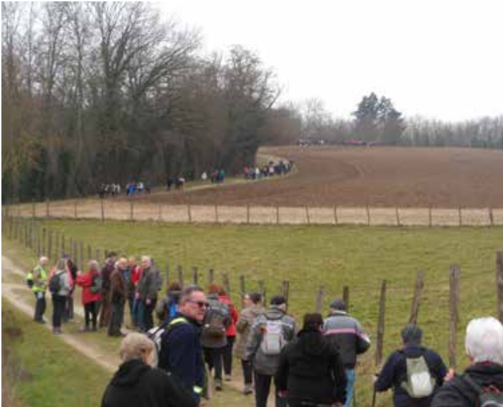
Le rallye pédestre

Nous participons à 8 sorties (marche en raquettes, ski de fond, marche avec des semelles crampons), organisées par notre comité directeur régional, départ en car les lundis répartis de janvier à mars.