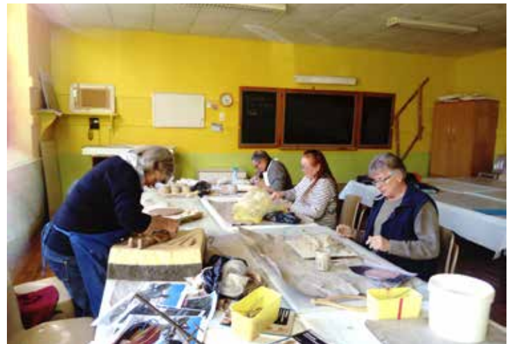
Les artistes au travail

N'hésitez pas à nous rejoindre si vous avez envie de créer !