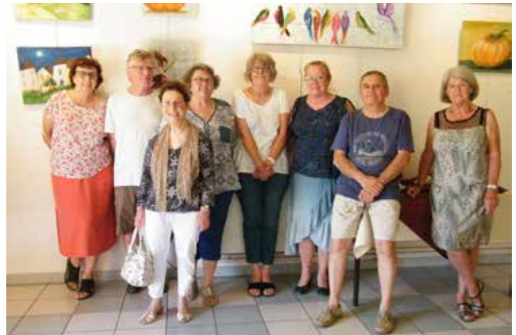
Les artistes lors de l'exposition

Nos visiteurs ont pu voir nos réalisations tant en peinture qu'en sculpture sur terre. Le livre d'or de notre association garde le souvenir de leur appréciation. Nous les en remercions vivement.