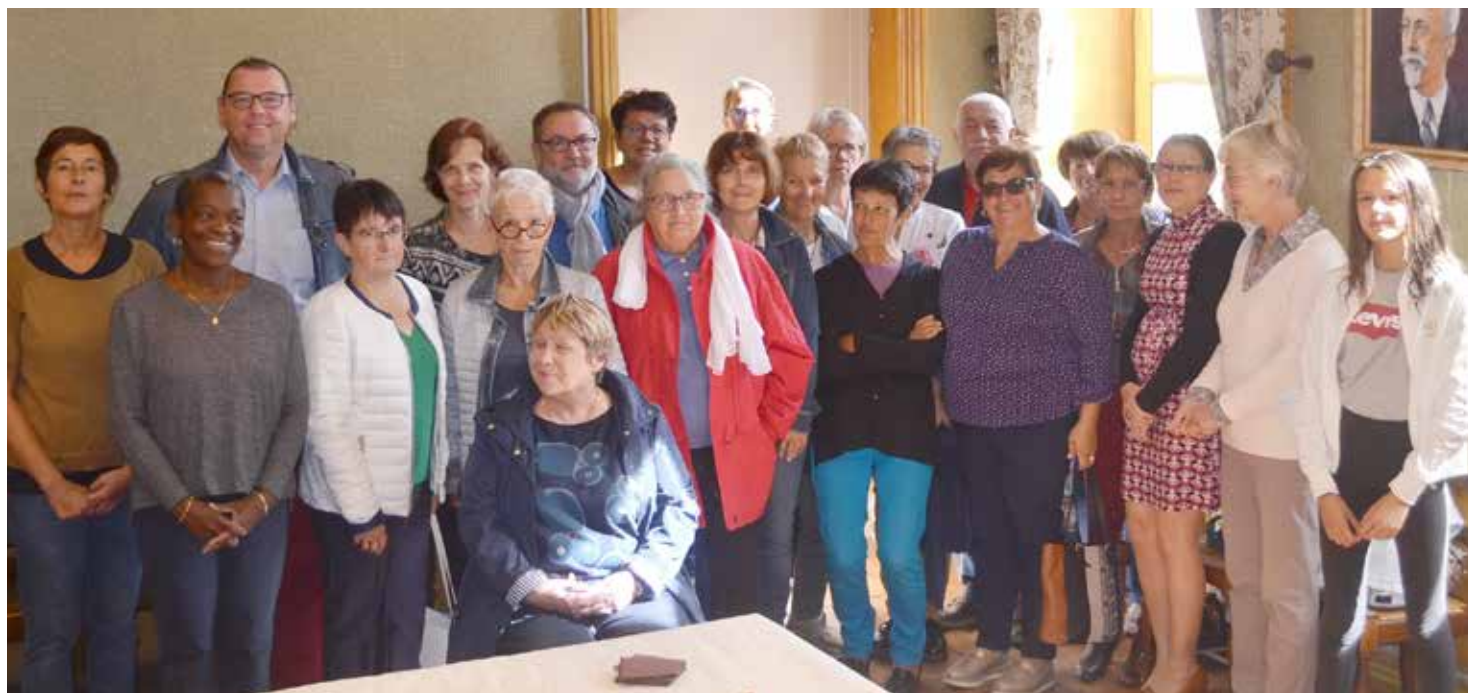
Bénévoles de l'aide aux devoirs - médiathèque - CCAS