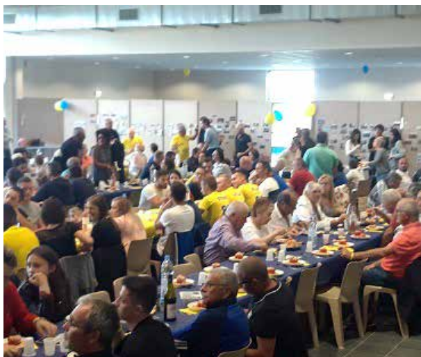
Repas des 80 ans du club

C'est au cours d'un bon banquet, que les 300 convives purent évoquer leurs anecdotes avant de regarder le match de la nouvelle équipe U15 du groupement Dolomieu Vézeronce Huert.