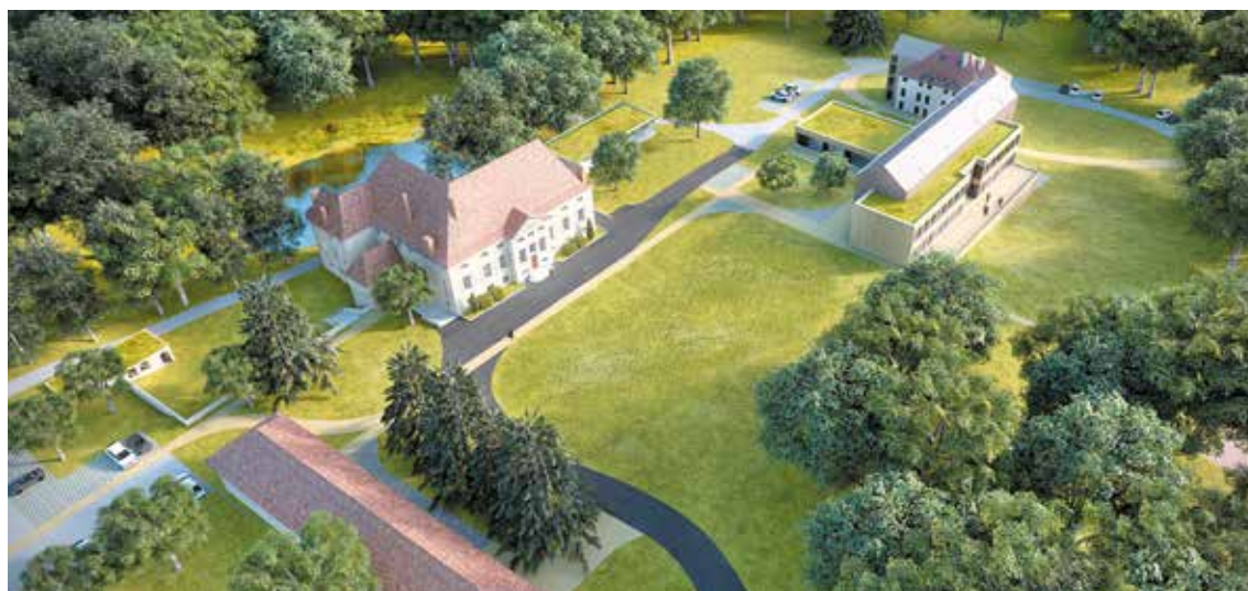
PHOTO 3D DU DOMAINE VUE DU CIEL

Hôtel de charme avec 52 chambres, deux restaurants et bars, un Spa by Sothys, un Golf Pitch & Putt de 9 trous et Le Campus : imaginez votre séjour au cœur d'un domaine, où toutes vos envies deviennent possibles...