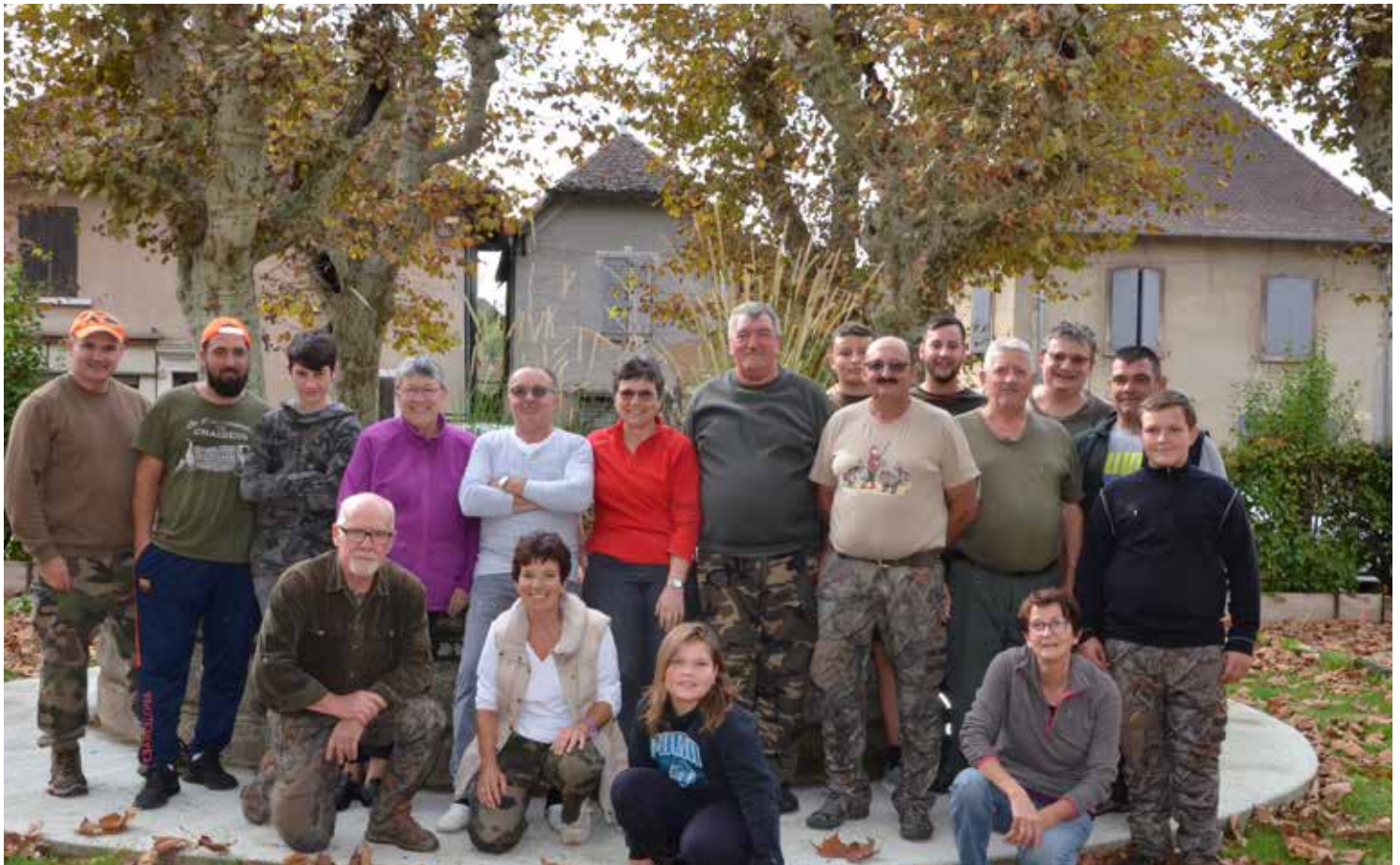
Le 27 octobre 2019 Un dimanche à la chasse

Nous sommes parfois sollicités par des agriculteurs ou des particuliers par rapport aux dégâts des sangliers dans les parcelles ou les jardins. Nous mettons tout en œuvre pour tenter de prélever ces sangliers mais pas forcément avec succès, les sangliers ayant une grande capacité de déplacement.