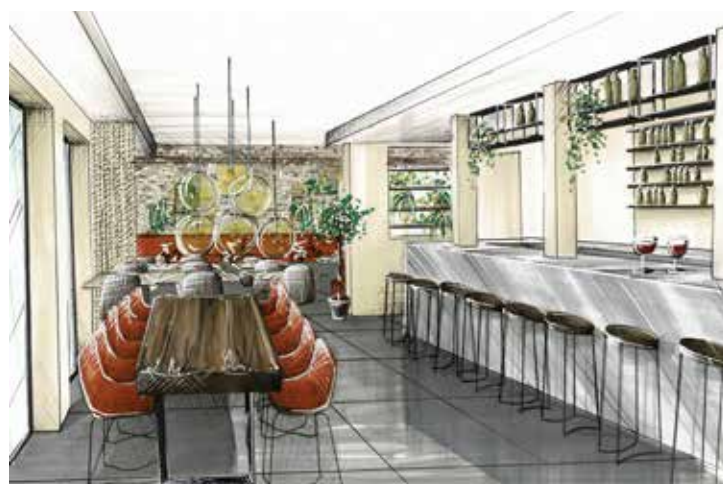
BRASSERIE

Aux Cyprès, espace contemporain à quelques pas du Château, la brasserie s'inscrit parfaitement dans l'environnement du parc. Le Chef déclinera les grands classiques de la cuisine bistrot : clubs sandwiches, tartares, burgers, salades, carpaccios et desserts, mais également des spécialités régionales cuisinées avec des produits issus du terroir par des fournisseurs passionnés : ravioles du Dauphiné, cuisses de grenouilles, poissons de lacs, fromages...