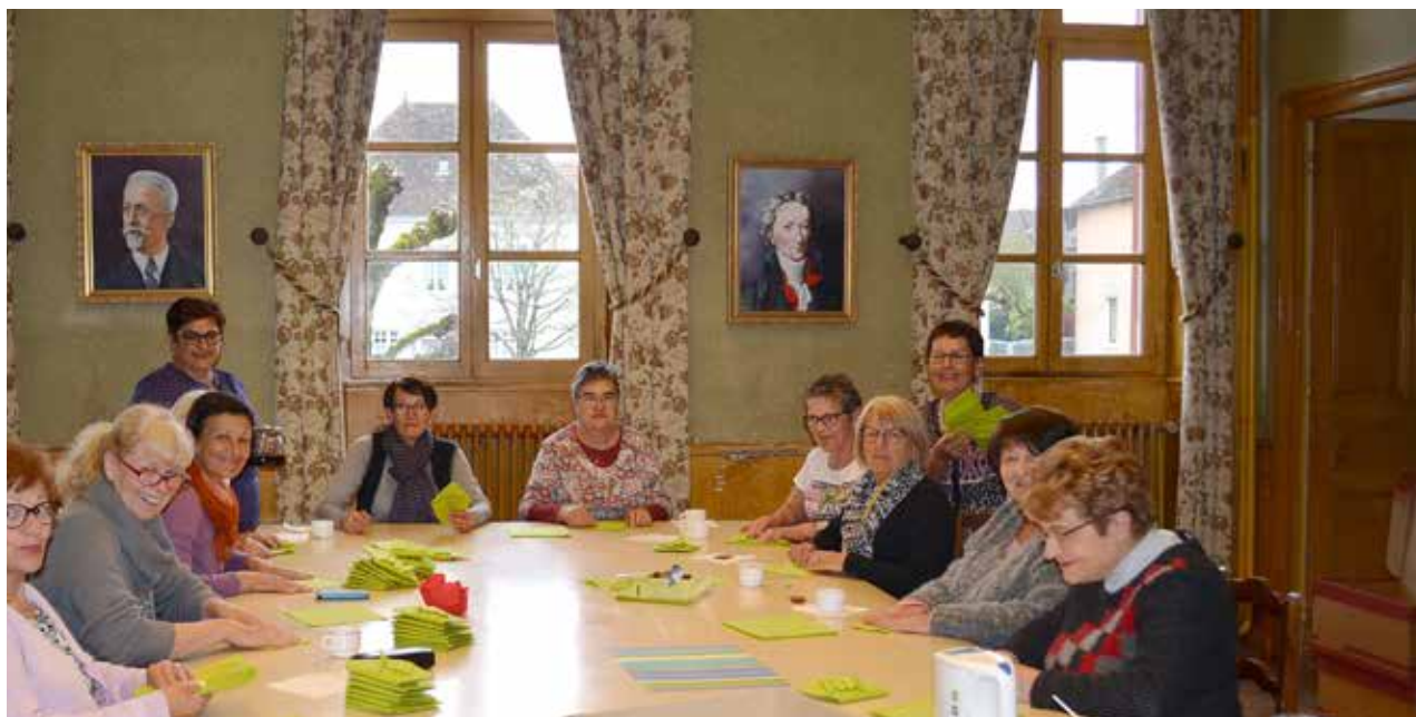
Les bénévoles du CCAS à l'oeuvre pour la décoration du repas offert aux Aînés de la commune