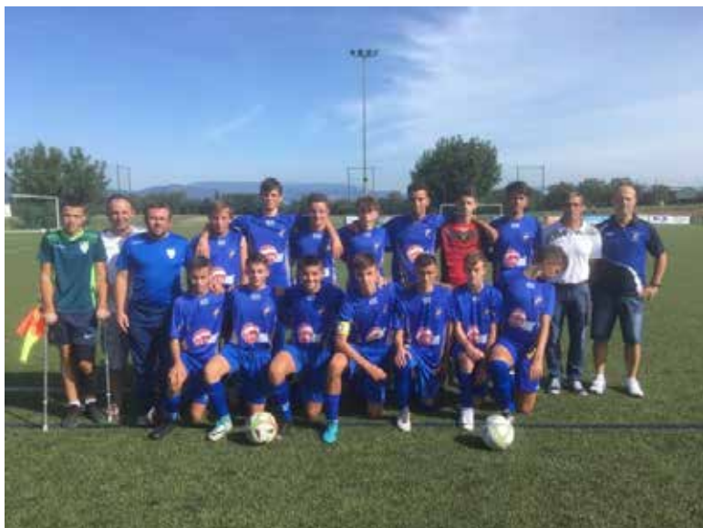
U18 Groupement DVH

Après les poules de brassage, les U18 finissent brillamment 1er de leur poule et accèdent à la D2.