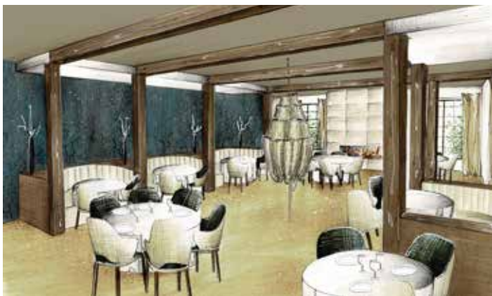
CROQUIS LISA RESTAURANT

Les Dolomites restaurant bistronomique, sera ouvert d'avril à septembre tous les jours au déjeuner et dîner. Et d'octobre à mars, au dîner et tous les dimanches au déjeuner – sera fermé les lundis et mardis.