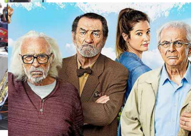
Les vieux fourneaux